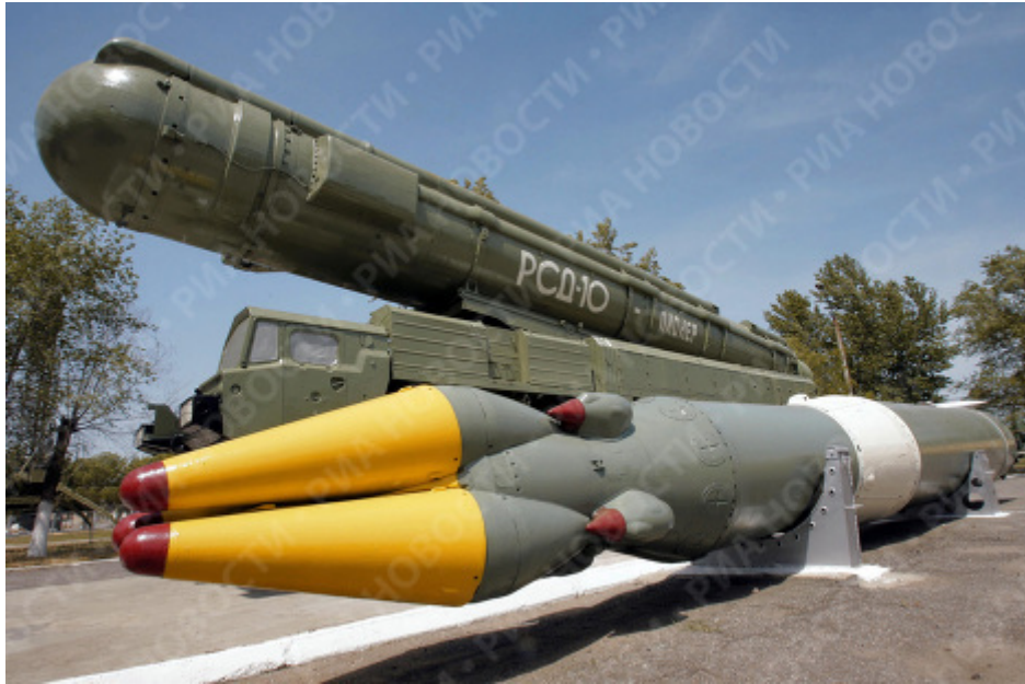
SS-20 i 1980-modifikationen med tre krigshoveder.