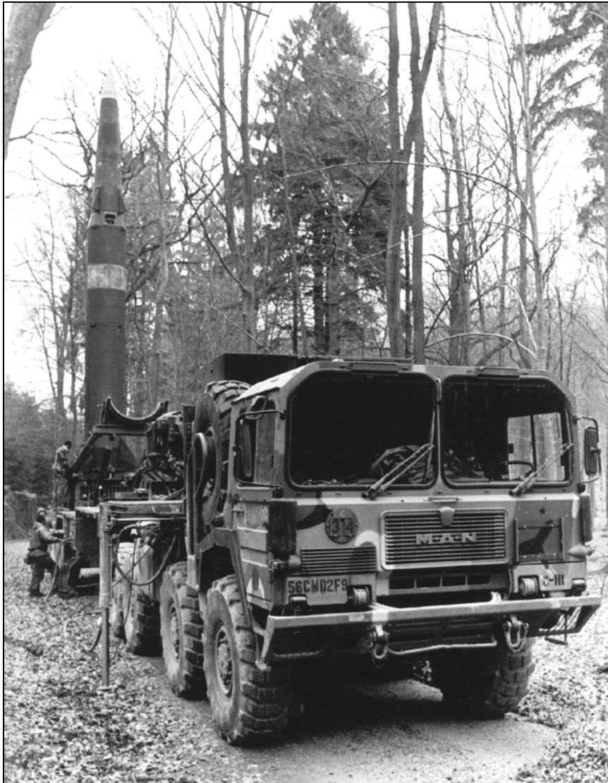
Det ekstremt præcise Pershing II-missil.

Den socialdemokratiske danske regering, der med den udbredte stærkt kritiske post-Vietnam holdning til USA blandt medlemmer og vælgere var helt ude af stand til at håndtere den understregning af kernevåbnenes rolle i NATOs afskrækkelses- og forsvarsstrategi, forsøgte forgæves at få alliancens beslutning udskudt i halvt år.