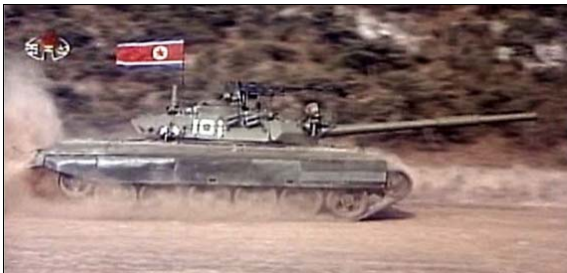
Moderniseret nordkoreansk kampvogn.

Også den tredje mulighed, Georgien-kopien, vil det være næsten umuligt at opbygge et passende svar på. Kombinationen af gasangreb mod sydkoreanske og amerikanske baser og depoter, der bl.a. anvender varig nervegas som VX, kombineret med indsættelse af de meget store specialstyrker (i sydkoreanske uniformer) mod chefer og hovedkvarterer samtidig med frembruddet over den demilitariserede zone af de massive invasionsstyrker vil sikre den ønskede indledningsvise succes. Hvis de nordkoreanske styrker derefter straks organiserer sig til forsvar af det erobrede område vil det politisk og militært blive ret umuligt at kaste dem tilbage, da det vil kræve en lang og på alle områder kostbar krigsførelse. Det er desværre mere end tvivlsomt, om Kina er klar til at øve det økonomiske og politiske pres, der kunne genskabe situationen før invasionen. Nordkorea vil som Anwar Sadat i 1973 gennem en begrænset satsning have opnået at skabe en ny politisk situation, en situation som vil blive opfattet som i Kinas geostrategiske interesse, fordi USA's position i Østasien med ét slag vil være væsentligt svækket.