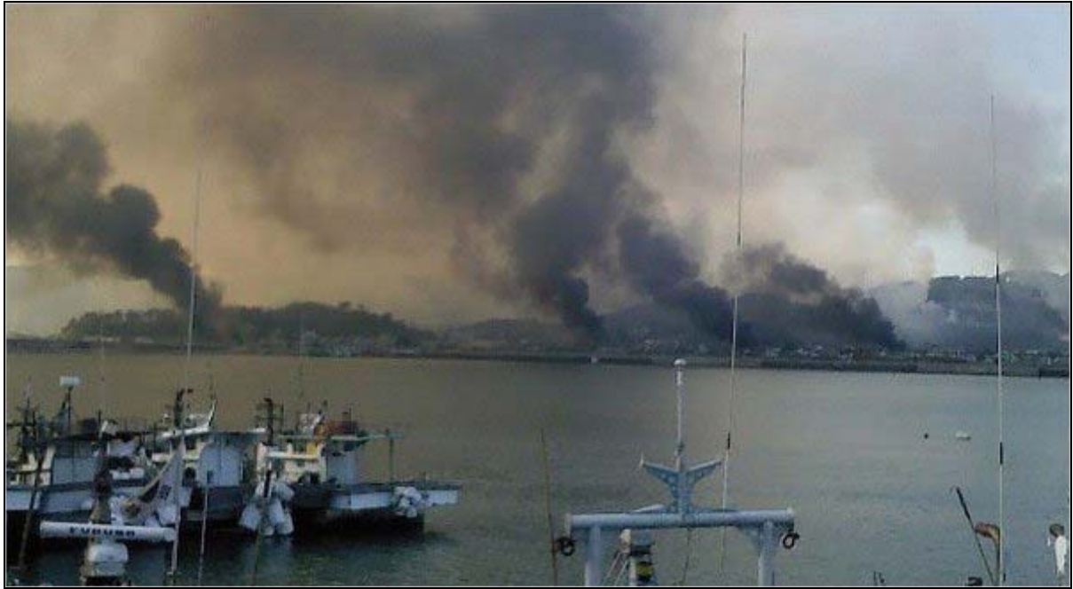
Brande på den beskydte grænseø Yeonpyeong.

Uanset hvilken af de tre muligheder, som de nordkoreanske generaler i givet fald måtte vælge, vil virkningerne på den nervøse verdensøkonomi blive ødelæggende. Men generalerne har ikke en aktie i verdensøkonomien, og deler ikke Vestens post-moderne holdning til den militære magts anvendelighed.