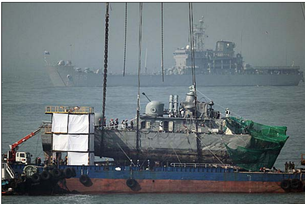
Den torpederede sydkoreanske korvet

Fordi det sydkoreanske folk ikke længere reagerer med eftergivenhed og USA allerede forhandler med Sydkorea om tiden efter det nordkoreanske sammenbrud. Og da Kina halvstøtter ved at nægte at tage afstand fra den nordkoreanske aggression for 60 år siden, kan man ikke udelukke, at de gamle generaler vil forsøge en flugt fremad i en ny storinvasion af det foragtede naboland.