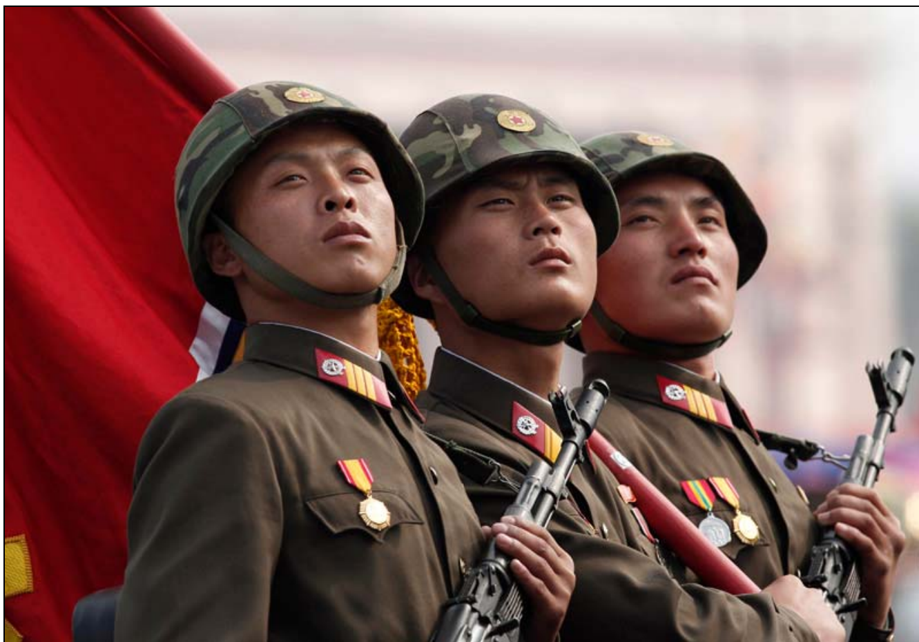
Den nordkoreanske hærs specialstyrker er samlet på 88.000.

Landets enorme lagre af en fuld vifte af kemiske våben er stadig blevet fornyet gennem produktion. En nordkoreansk invasion vil komme overraskende og ramme hårdt, uanset at geografien, infrastrukturen og invasionens politiske formål gør det forventeligt, at hovedoffensiven rettes mod Seoul. Sydkorea og landets tøvende amerikanske allierede er politisk hæmmede af, at de ud over at gennemføre solidaritetsmarkerende øvelser må afvente situationens udvikling. De kan ikke foretage omfattende forsvarsforberedelser og slet ikke flyangreb på Nord før en større nordkoreansk invasion er en indiskutabel realitet. Derefter kan de kun håbe på, at deres materiels tekniske overlegenhed og piloternes langt større rutine vil gøre det muligt at inddæmme og standse den nordkoreanske fremrykning.